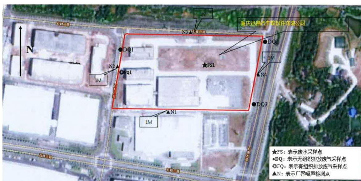
图 6-1 监测点位布点图